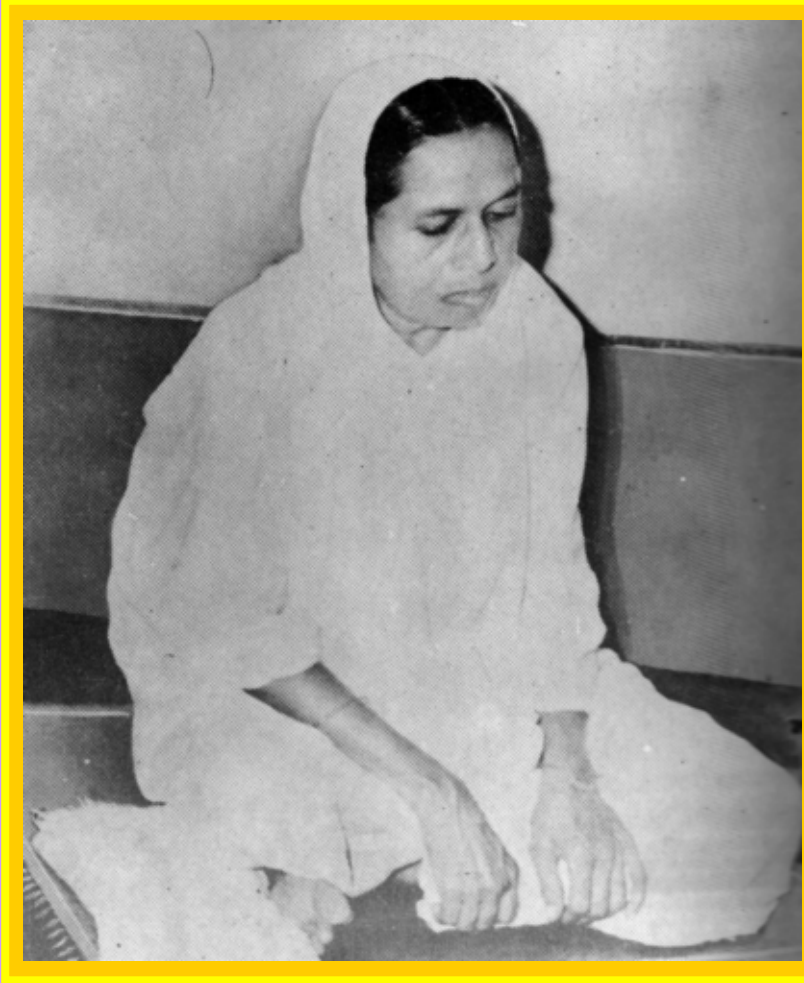
प्रशममूर्ति पूज्य बडेनश्री चंपाबेन